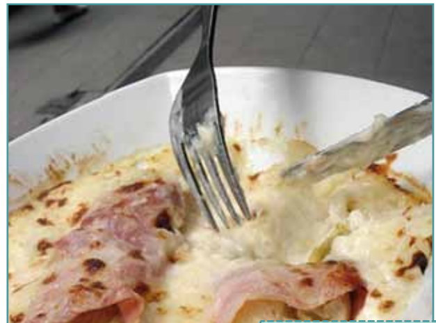
chicons au gratin