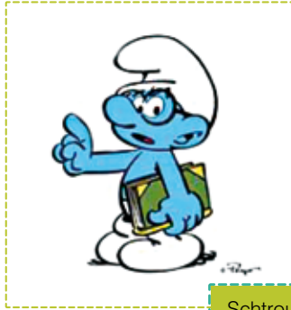
Schtroumpf à Lunettes

Raconter l'histoire, montrer le dessin du Schtroumpf à Lunettes